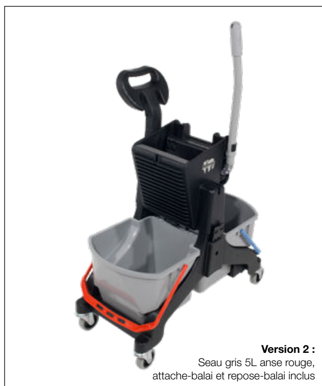
Seau 5L anse rouge